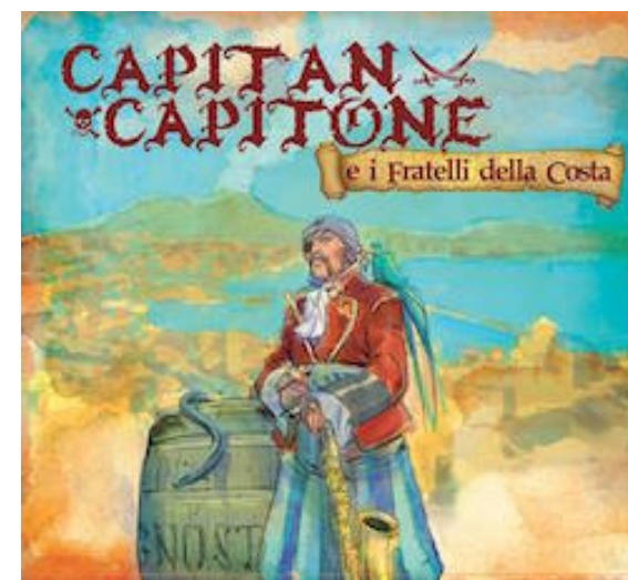
Capitan Capitone e i Fratelli della Costa